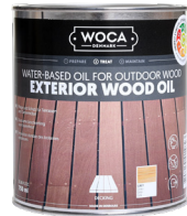
EXTERIOR WOOD OIL 1L