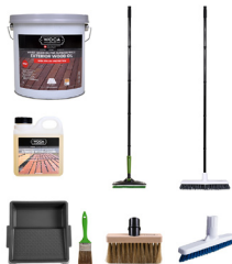
TERASSEN STARTER SET