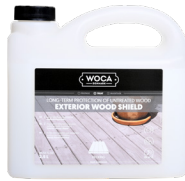
EXTERIOR WOOD SHIELD