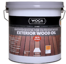
EXTERIOR WOOD OIL 3L