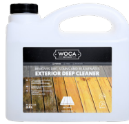
EXTERIOR DEEP CLEANER